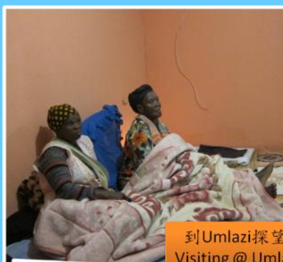
到Umlazi探望父親過世的一位姐妹 Visiting @ Umlazi for bring condolence