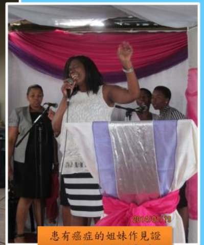
患有癌症的姐妹作見證 Mam Tenza testified