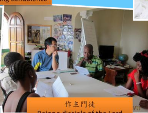
作主門徒 Being a disciple of the Lord