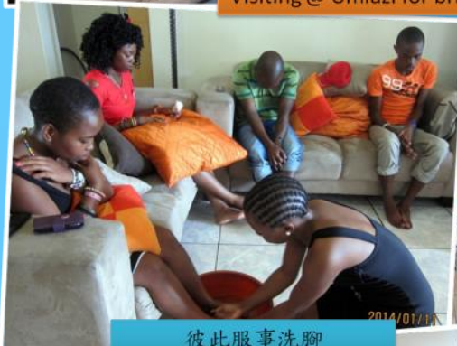
彼此服事洗腳 Wash one another's feet