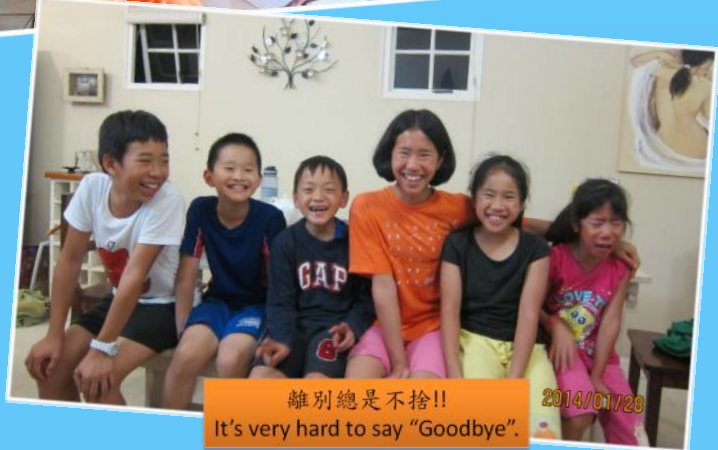
離別總是不捨!! It's very hard to say "Goodbye".