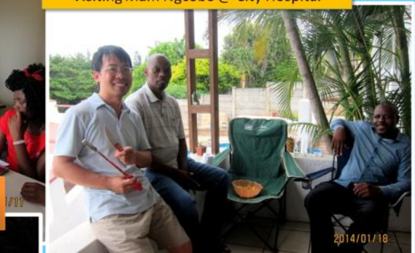
接待兩位長老家庭 Hospitality to Bab Nadlovu & Hlongwane family